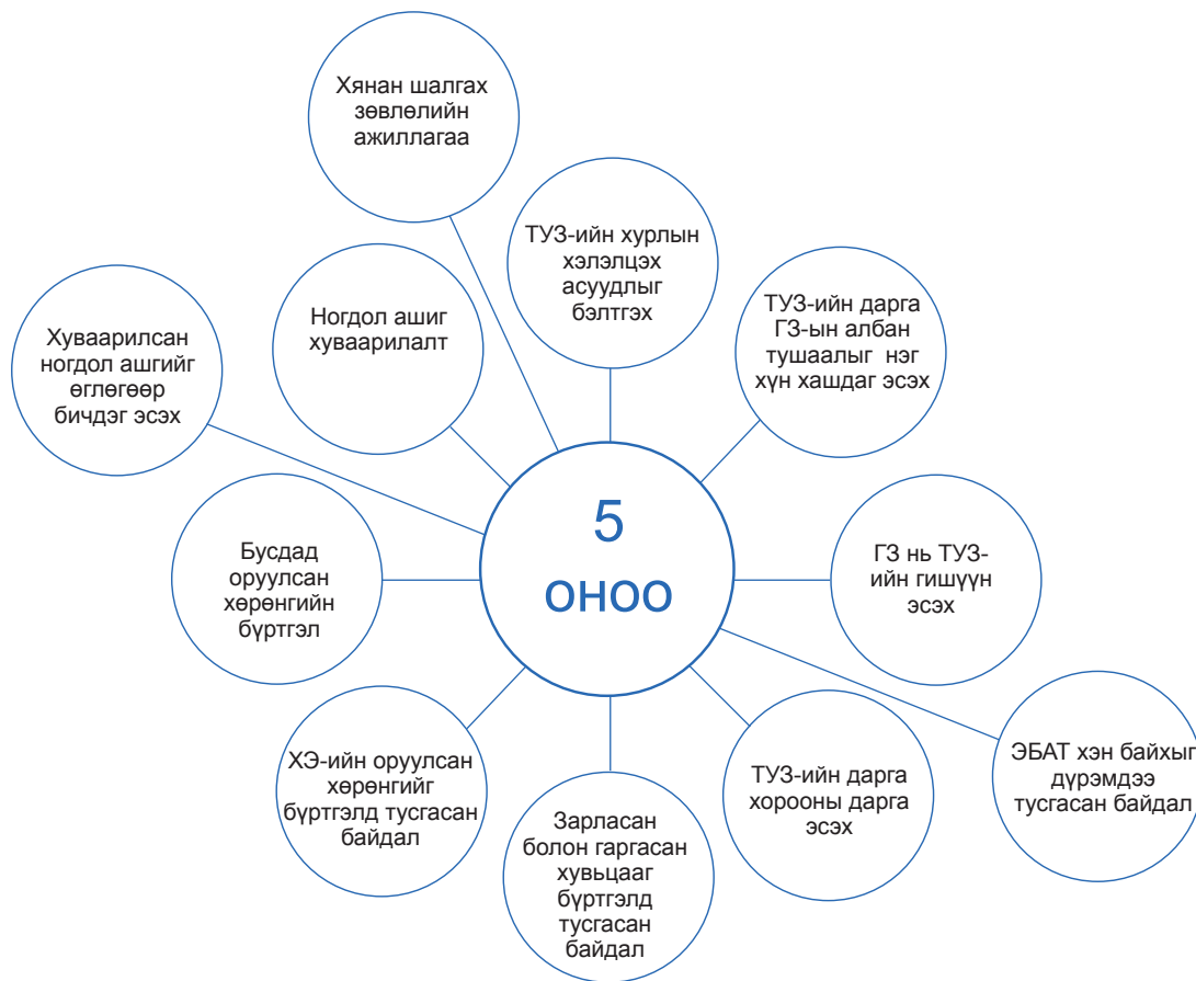
Зураг 2. Эрдэнэт үйлдвэр ХК-ийн засаглалын үнэлгээнд сайн буюу 5 оноо авсан асуулгууд

Үүнээс гадна үнэлгээний үзүүлэлтийн нийт 130 асуулгаас 83 буюу 63.8 хувьд “0” үнэлгээ авсан нь компанийн засаглалын түвшин доогуур гарах гол шалтгаан болсон. Нийт үнэлгээнд “0” үнэлгээ авсан үзүүлэлтүүдийн эзлэх тоо, хэмжээг Хүснэгт 2-т үзүүлэв.